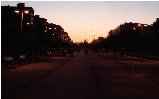
El representante vecinal quiere un Bulevar del Pla transitable.

en comunidad ejemplar. El Evangelio ilustra cómo es realmente el auténtico corporativismo. El amor y la caridad pueden con todo.